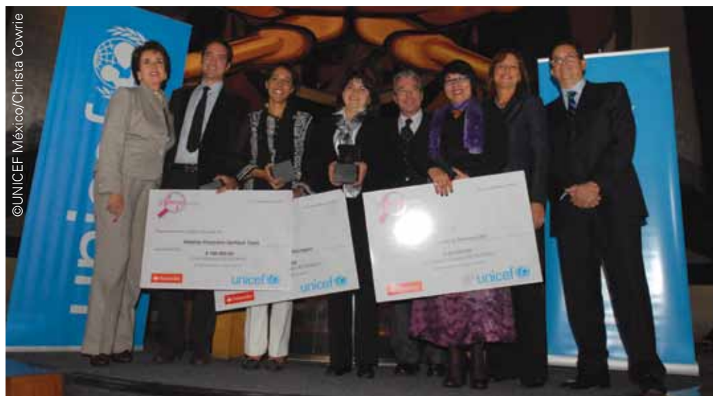
Ganadores categoría Mejor Investigación

En coordinación con la Red por los Derechos de la Infancia (REDIM) y la Junta de Asistencia Privada del Distrito Federal (JAPDF) se realizó el foro “Derechos de la infancia y la adolescencia en México: construyendo buenas prácticas” con el objetivo de promover el intercambio de conocimiento sobre experiencias exitosas tanto en el país como en la región. El foro se enmarcó bajo la convocatoria del Segundo Premio UNICEF 2009 y contó con la participación de alrededor de 150 organizaciones de la sociedad civil, incluyendo como ponentes a los ganadores de la categoría de Mejores Prácticas de la primera edición del Premio UNICEF.