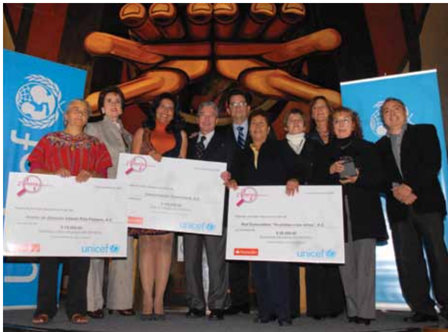
Ganadores categoría Mejores Prácticas